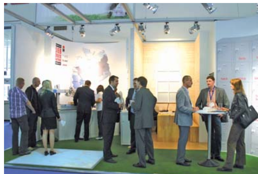
Besprechungen in der „Spielerkabine“ oder auf dem „Spielfeld“ – die Siebdruck-Partner bleiben immer am Ball.