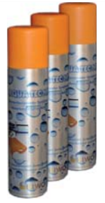
Der wasserbasierende Sprühkleber AQUA TEC NF 2 von KIWO