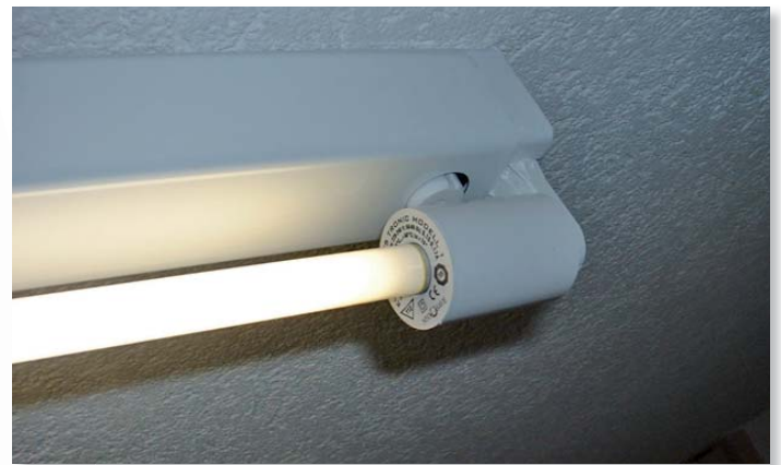
Sparen Sie über 50 % Energiekosten mit den EVG-Aufstecksystemen

Allein in Deutschland wird die Zahl der stabförmigen Leuchtstoffröhren auf 400 Millionen Stück geschätzt, von denen 67 % mit herkömmlichen elektromagnetischen (KVG und VVG) Betriebsgeräten und T8-Röhren bestückt sind. Für Leuchten dieser Bauart bieten verschiedene Hersteller Aufstecksysteme mit integrierten elektronischen Betriebsgeräten (EVGs), die z. B. beim Einsatz einer T5-Röhre statt 72 W eine Leistungsaufnahme von nur 36 W haben.