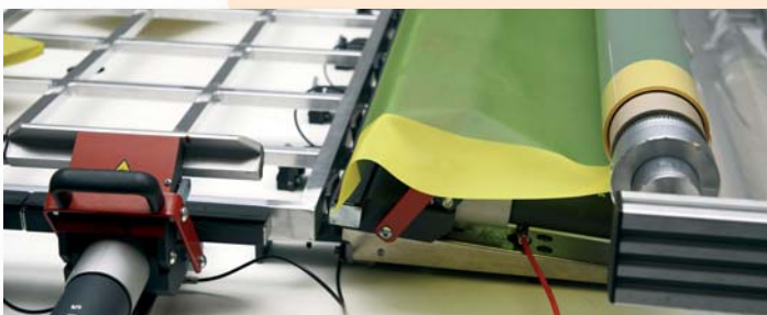
Das Abrollen des vollbeschichteten Siebdruckgewebes