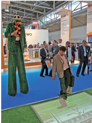
Gute Laune bei den Messebesuchern: Mit dem interaktiven Fußballspiel lockten die Siebdruck-Partner so manchen Gast aus der Reserve.

Die Siebdruck-Partner haben auch in diesem Jahr die FESPA als Plattform genutzt, um „spielstark“ ihr gebündeltes Knowhow darzustellen. So konnten sich Interessenten davon überzeugen, dass sie mit den Topteams der Siebdruck-Partner technisch wie wirtschaftlich immer „am Ball“ sind. Großen Anklang fand auch ein kleiner Fanartikel, der live auf einer Siebdruckmaschine bedruckt wurde: „Klapper-Trikots am Stiel“. Jeder Besucher