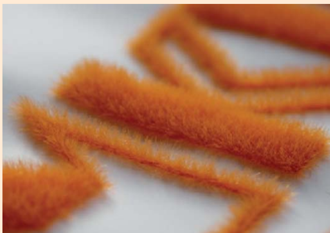
So lang – so weich: Papierbeflockung mit langer 2,5-mm-Faser

Flockfasern sind kurze, geschnittene Monofilamente aus Polyester, Polyamid und Viskose. Bei der elektrostatischen Beflockung werden Millionen dieser kurz geschnittenen Fasern in einem elektrischen Feld in ein mit Klebstoff beschichtetes Substrat eingeschossen.