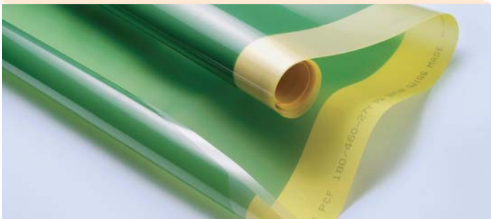
SEFAR® PreCoated Fabrics – vollbeschichtet