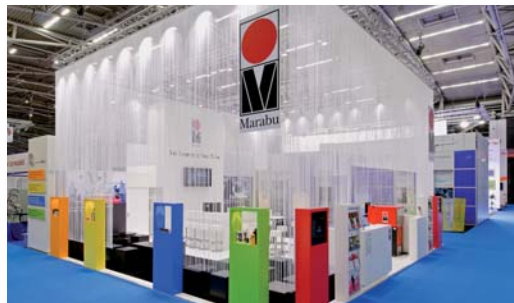
Bunt und einladend – der Stand von Marabu auf der FESPA 2010

Fortsetzung Auch auf den eigenen Ständen der Hersteller spielte sich so einiges ab: Marabu war in diesem Jahr gleich zwei Mal auf der FESPA vertreten: Im Siebdruck- und Digitaldruckbereich. Gemeinsam mit dem Kooperationspartner Sakurai wurden „live und in Farbe“ Reliefveredelungen und Spezialeffekte demonstriert. Zudem wurde Marajet DI-V, die Digitaldruckfarbe für die Super Wide-Anlagen wie auch die neuen UV-härtenden Marashield Flüssigbeschichtungen präsentiert. Als Weltneuheit wurde die Marabu MCD Micro vorgestellt, mit der automatisches Dosieren von UV- und Lösemittelfarben auf 1 m 2 möglich ist! KIWO präsentierte Produktglanzlichter aus unterschiedlichsten Bereichen: die neueste Technik KIWO I-Jet 2, Kopierschichten wie AZOCOL Z 133, AZOCOL Z 180 Nanocoat oder die leitfähige Kopierschicht AZOCOL S 385 Conduct + KIWO FILLER 409 Conduct. Des Weiteren wurden