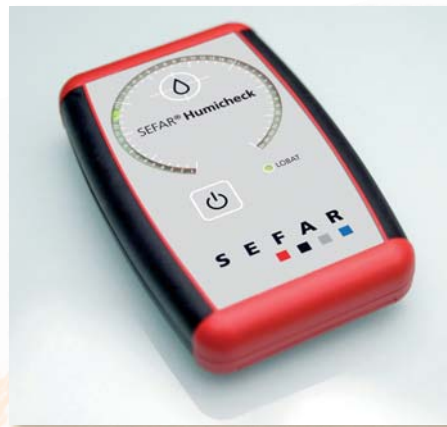
Zuverlässig: SEFAR® Humicheck überwacht den Trocknungsprozess

Weitere Informationen finden Sie unter www.sefar.ch