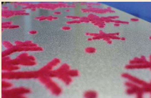
Eine beflockte Blechdose – ein begeisterndes haptisches Erlebnis

Ein beflockter Gegenstand überrascht durch seine Haptik und Oberfläche – und begegnet uns im Alltag überall: Zur Verbesserung der Haptik, zur Geräuschkämpfung, zum Toleranzausgleich oder bei der Thermoisolierung. All dies kann auf Untergründen wie Textilien, Kunststoffen, Metallen, Glas, Holz, Folien und Papier angewendet werden.