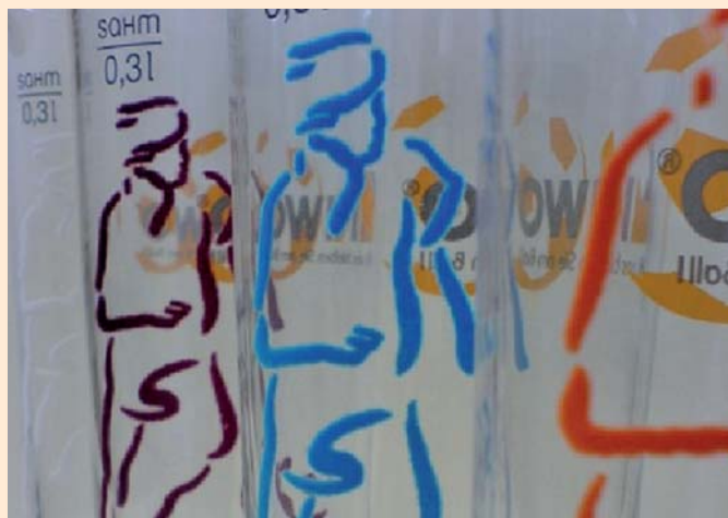
Sogar runde Elemente können spülmaschinenfest beflockt werden

www.kiwo.de erfahren Sie mehr zur Beflockungstechnik.