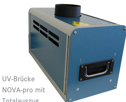
UV-Brücke NOVA-pro mit Totalauszug

Marabu ist ebenso vor Ort und präsentiert seine Farblösungen für den industriellen Druck in Halle A6, Stand 527. www.inprintshow.com/germany/2017