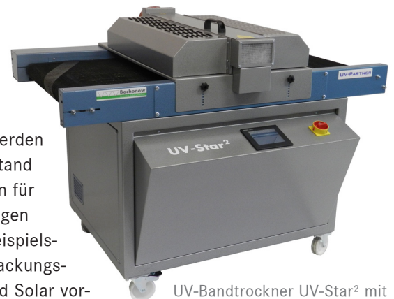
UV-Bandtrockner UV-Star² mit elektronischem Vorschaltgerät und Touchbedienung

Bochonow fokussiert sich auf die Präsentation von Innovationen aus dem Bereich der Siebherstellung und der Farbtrocknung. Seitens Frintrup werden dem fachkundigen Publikum am Stand hochwertige Siebdruck-Schablonen für eine Reihe von Industrieanwendungen unterschiedlicher Branchen wie beispielsweise Automotive, Glas- und Verpackungsindustrie, Etiketten, Elektronik, und Solar vorgestellt.